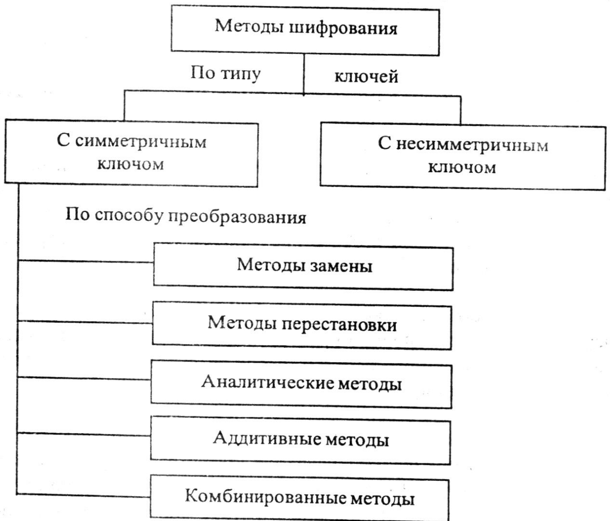
Рис. 2. Классификация методов шифрования

Все методы шифрования могут быть классифицированы по различным признакам. Один из вариантов классификации приведен на рис.2.