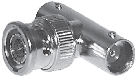
Рис. 1. Т-коннектор